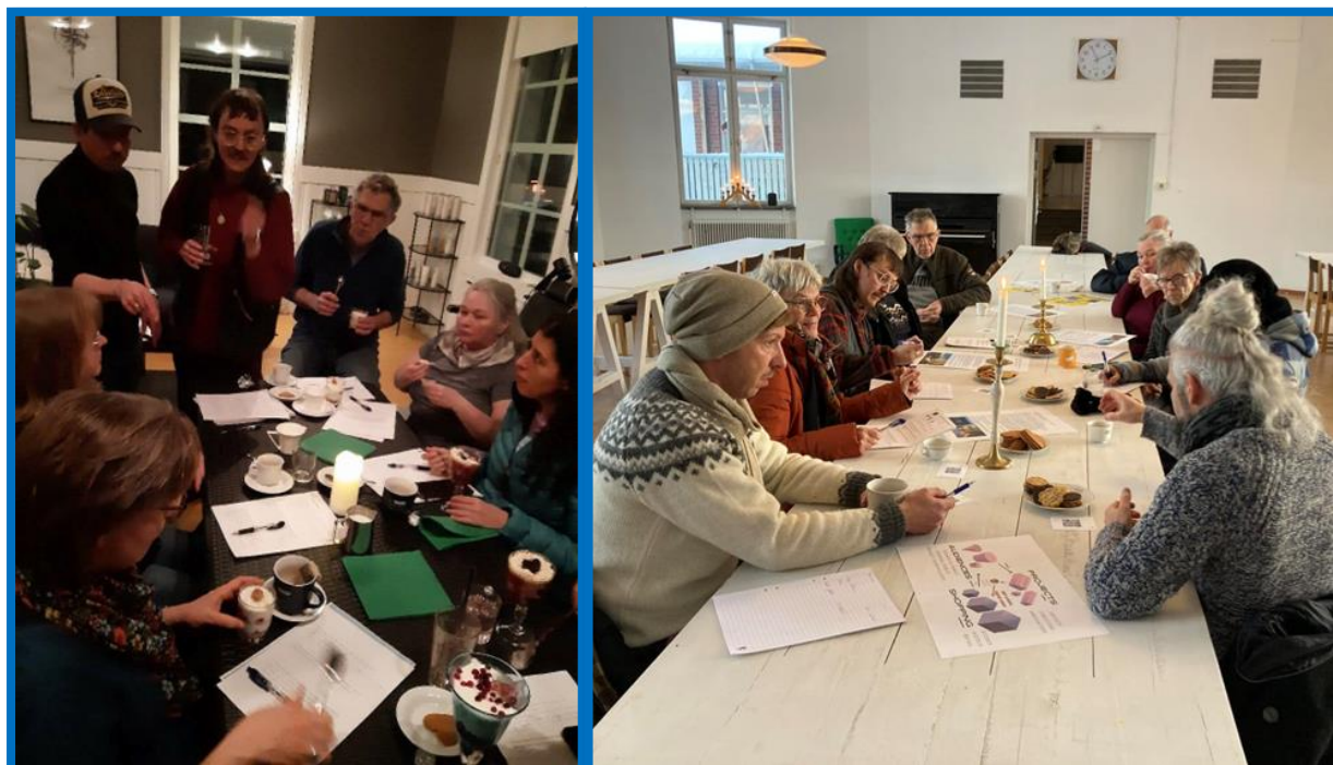
Bilder från dialog- och arbetsmöten i Grundträsk och Moskosel inom ramen för projekt "Medskapande processer för hållbar service i Malåbygden" år 2023-2024