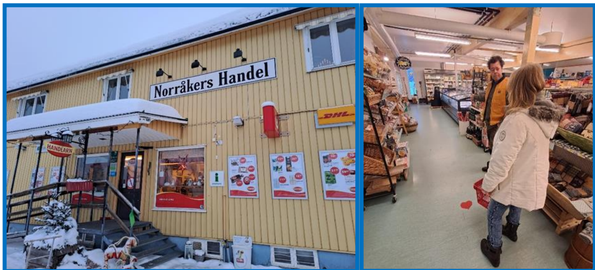
Bilder från studiebesök för omvärldsbevakning på Norråkers handel inom ramen för projekt "Medskapande processer för hållbar service i Malåbygden" år 2023-2024.