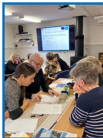
Bilder från Dialogform i Springliden inom ramen för projekt "Medskapande processer för hållbar service i Malåbygden" år 2024.